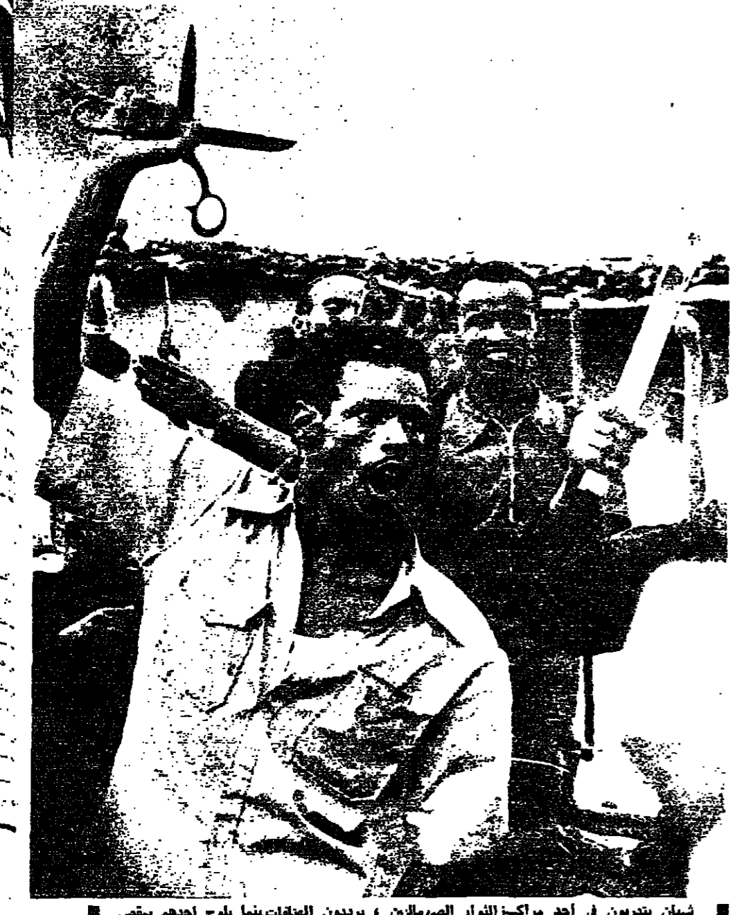
شبان يدورون في أحد مراكز الثوار الصوماليين، يرددون الهتافات بينما يلوح بأحد أهم بقرص